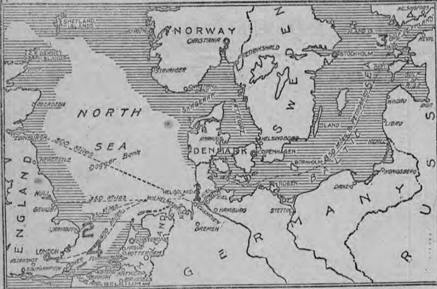
BIG GUNS ON ENGLISH WARSHIP MAP OF NORTH SEA AND BALTIC SEA

El mapa muestra los mares del Norte y Báltico que, según los últimos informes, constituyen el campo de operaciones de la marina alemana. No hace mucho tiempo que una formidable flota alemana zarpó del Canal de Kiel y como los barcos de guerra ingleses la esperan desde que comenzó la guerra, una batalla naval es posible de un momento a otro. El grabado superior muestra los grandes cañones a bordo de un barco de guerra inglés.