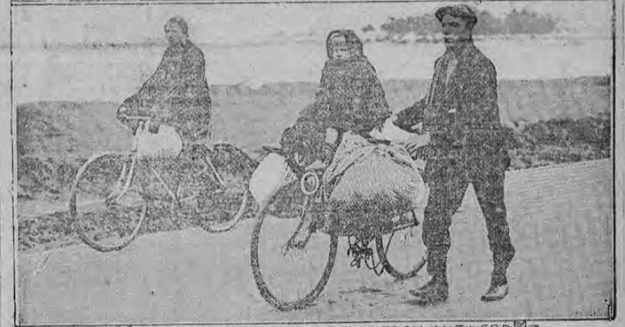
MILLARES DE REFUGIADOS BELGAS, LA MAYOR PARTE DE ELLOS MUJERES Y NIÑOS, HAN HUIDO DE BÉLGICA ante el avance de los alemanes. Estos dos grabados constituyen una verdadera relación de las vicisitudes de la fuga. Dan detalles interesantes sobre el éxodo.