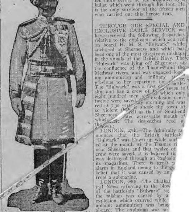
SIR PERTAB SINGH