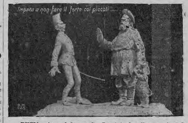
RUSIA (en defensa de Servia) le dice a Austria: —Ten cuidado si abusas de tu fuerza contra los débiles...