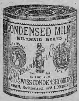
Facsimil de la lata de leche marca "La Lechera"

A LOS SEÑORES MEDICOS, HOSPITALES, COMERCIANTES, MADRES DE FAMILIA, Y AL PUBLICO EN GENERAL